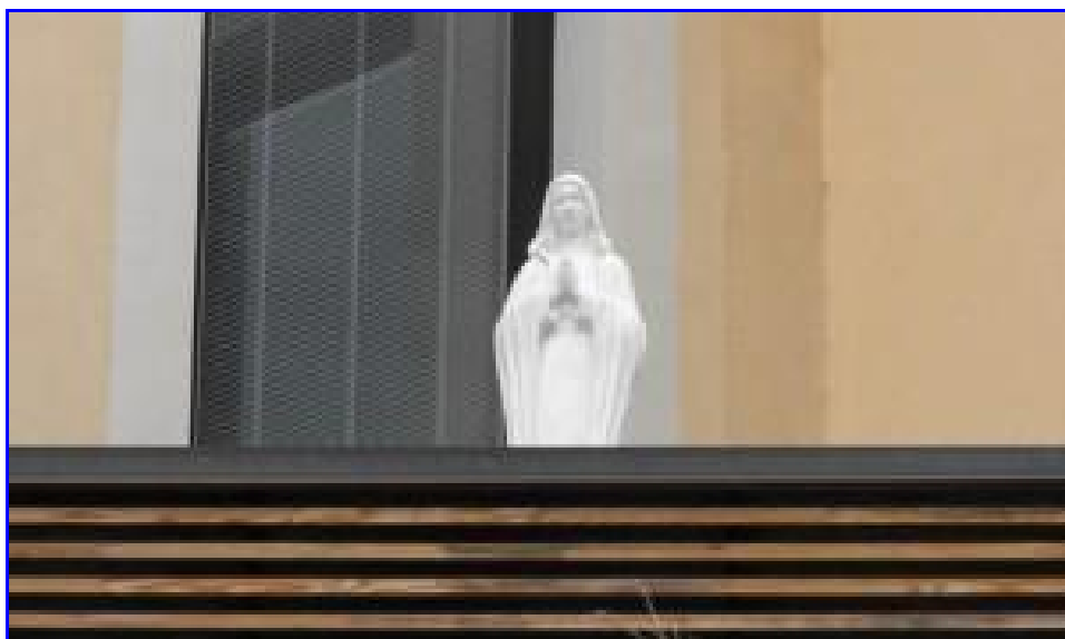
Pho tượng trên ban công của Hội Trường Thành Phố Meda

Một pho tượng nhỏ Đức Trinh Nữ Maria được chuộc ở Mễ Du đã trở thành một đề tài chú ý chính trị ở Meda, miền bắc nước Ý. Chính vị thị trưởng của thành phố đã chuộc và dựng tại Hội Trường Thành Phố, pho tượng đã gây lo ngại các nhà chính trị địa phương, những người đang kêu gọi chuyển pho tượng đi, vì nước Ý là một nhà nước thế tục.