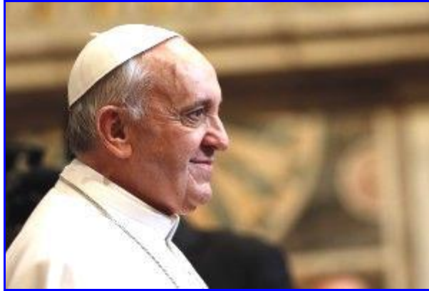
Đức Giáo Hoàng Phan-xi-cô