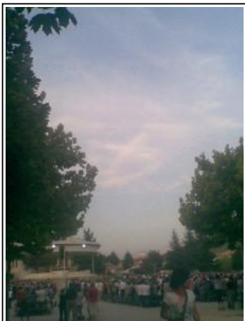
Hình Thánh Giá hiện ra trên đám mây trong Thánh Lễ chiều ngày 22-06

Mặc dù con số này có vẻ quá cao, mà Mễ Du lại không có đủ nhà cho số khách hành hương này trọ, nhưng có nhiều người từ các vùng phụ cận Mễ Du có khả năng phục vụ, khiến cho con số dự kiến này trở nên đáng tin cậy hơn.